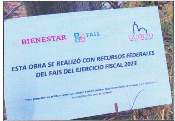
COLOCACIÓN DE PLACA INFORMATIVA.