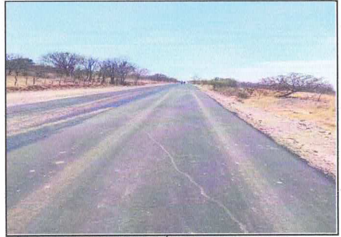
TENDIDO Y COMPACTACIÓN DE CARPETA ASFALTICA.