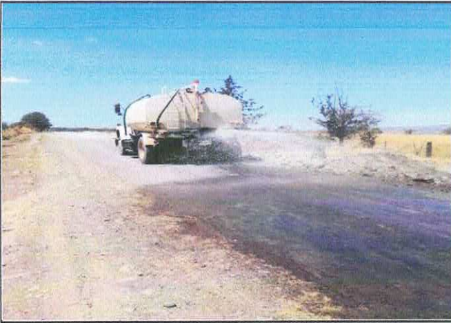
HUMEDECIENDO EL TERRENO PARA TENDIDO DE MATERIAL.

COLOCACIÓN DE CARPETA ASFALTICA EN LA LOCALIDAD DE EL DERRAMADERO EN UNA SUPERFICIE DE 1,140 ML.