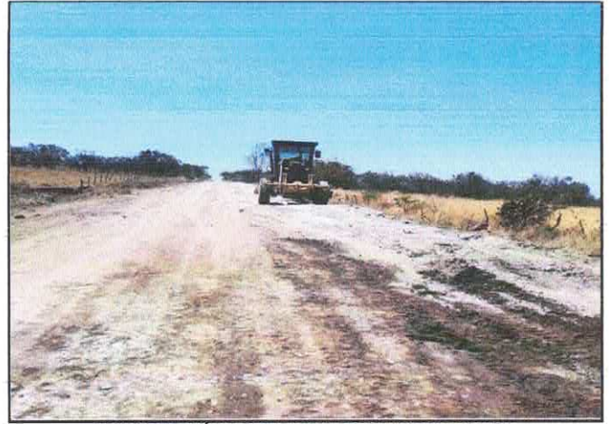
COMPACTACIÓN DE MATERIAL DE BANCO Y BACHEO.